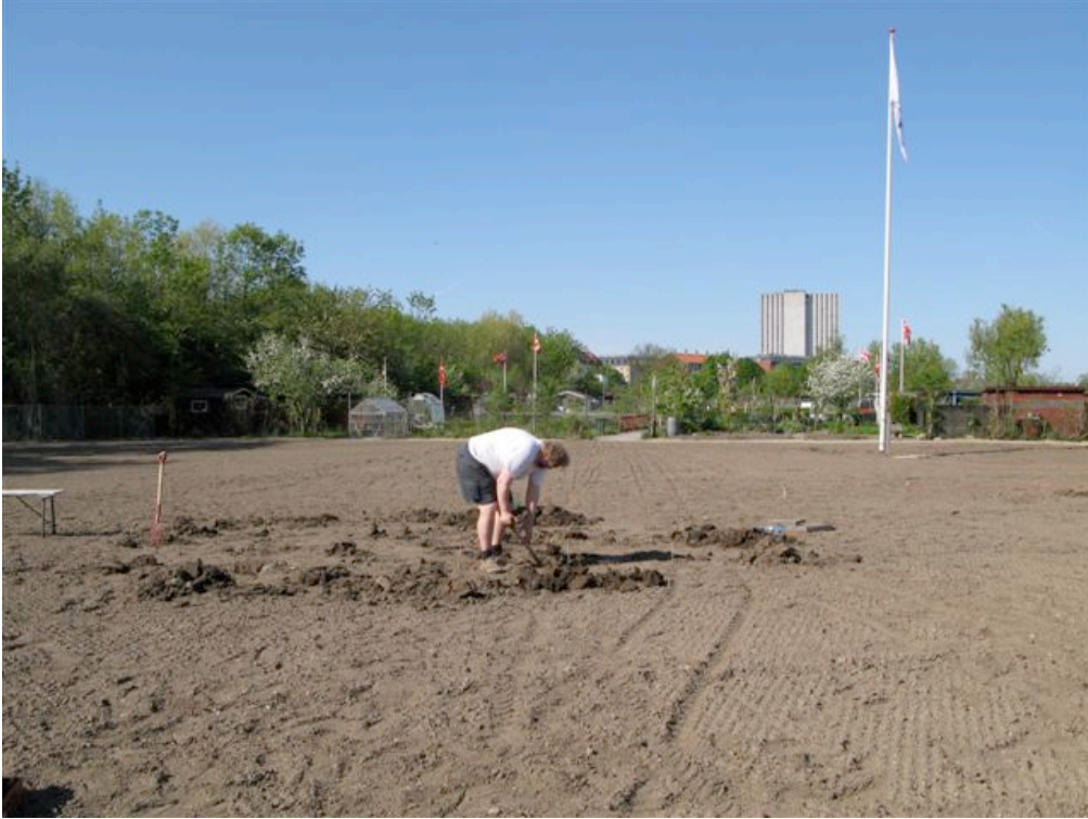
Nigels første spadestik 2008